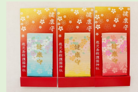
①⑧ 健康守(青・黄・ピンク) (縦 24 cm、横 8 cm)

活火山である桜島の力をいただき、あらゆる困難に打ち克つよう祈願された、鹿児島県ならではの御守です。御神域にて採取し、お清めした桜島の火山灰が封入されています。