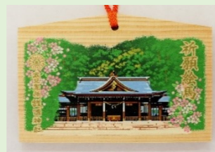
②① 祈願絵馬 (縦 9.2 cm、横 13.7 cm)