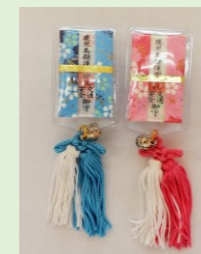
①⑧ 交通安全守(吸盤付) (青・ピンク) (縦 12.5 cm、横 3.2 cm)