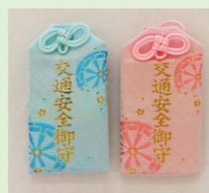
①③ 交通安全錦守 (青・ピンク) (縦 7 cm、横 4 cm)