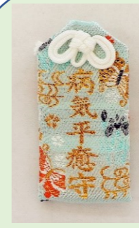
①⑩ 病気平癒守 (縦 8.8 cm、横 4 cm)