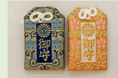
①⑦ 錦守(縦 8 cm、横 4.8 cm) (水色・ピンク・青・金)