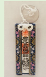
①⑥ 交通安全守(吸盤付) (札型・桜柄) (縦 10.5 cm、横 4.5 cm)