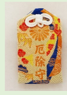
①⑨ 厄除守 (縦 8 cm、横 4.8 cm)