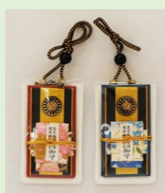
①⑤ 交通安全守(社紋付) (青・ピンク) (縦 6.7 cm、横 4 cm)