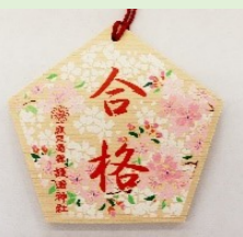
②② 合格祈願絵馬 (縦 14 cm、横 15.5 cm)