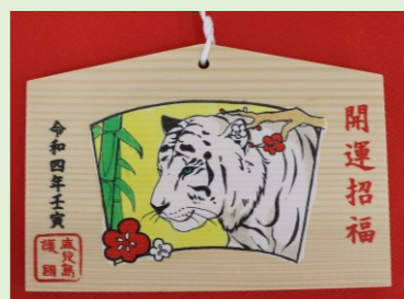
②③ 干支絵馬(寅) (縦 10.5 cm、横 15.5 cm)