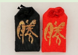
①⑪ 勝守(黒・赤) (縦 7 cm、横 4 cm)