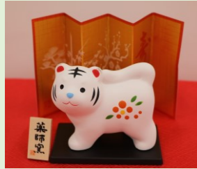
②⑥ 開運干支置物 (縦 8.6 cm、横 9 cm) ※縦横は屏風の長さ