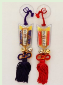
①⑦ 交通安全守(吸盤付) (干支付 水色・ピンク) (縦 13 cm、横 3.3 cm)