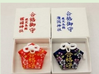
①② 合格守(青・赤) (縦・横 5 cm)