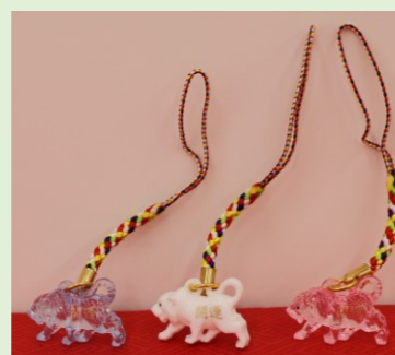
②④ 干支根付守 (白・青・ピンク) (縦 10 cm、横 2.7 cm)