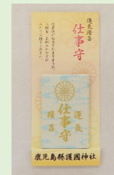
②⑩ 仕事守 (縦 6.5 cm・横 4.2 cm) 仕事運が向上するよう、 財布やバックなどに入れ てご加護を願います。