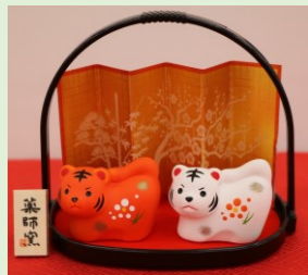
②⑦ 開運干支置物 (縦 11 cm、横 12.5 cm) ※縦横はお盆取っ手の長さ