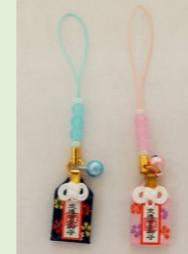
①④ 交通安全根付守 (青・ピンク) (縦 11 cm、横 2 cm)