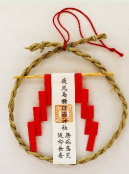
①⑨ 茅の輪守 (縦 12 cm・横 12 cm) 玄関の高い所に祀り、 家内の災い事を除ける 御守です。