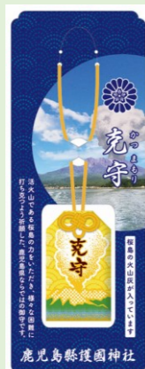
②⑤ 克守(かつまもり) (縦 5.2 cm・横 3 cm)