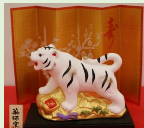
②⑧ 開運干支置物 (縦 13 cm、横 14 cm) ※縦横は屏風の長さ