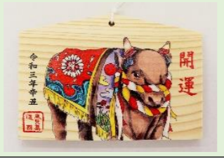
㉔ 千支絵馬 (丑) (縦 10.5 cm、横 15.5 cm)