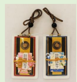
⑮ 交通安全守 (社紋付) (青・ピンク) (縦 6.7 cm、横 4 cm)