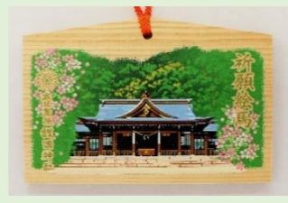
㉑ 祈願絵馬 (縦 9.2 cm、横 13.7 cm)