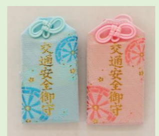
⑬ 交通安全錦守 (青・ピンク) (縦 7 cm、横 4 cm)