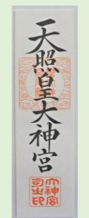
③ 神宮大麻 (縦 24.5 cm、横 6.8 cm)