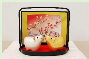
⑳ 開運千支置物 (縦 11 cm、横 12.5 cm) ※縦横はお盆取っ手の長さ