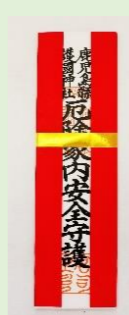
④ 家内安全厄除札 (縦 22.5 cm、横 6.3 cm)