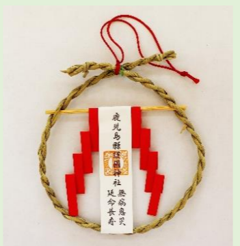
⑲ 茅の輪守 (縦 12 cm、横 12 cm) 玄関の高い所に祀り、 家内の災い事を除ける 御守です。