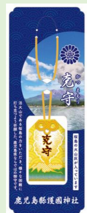
㉖ 克守 (かつまもり) (縦 5.2 cm、横 3 cm)