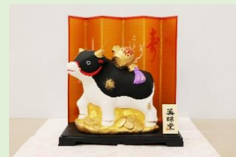
㉑ 開運千支置物 (縦 13 cm、横 14 cm) ※縦横は屏風の長さ