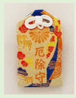
⑨ 厄除守 (縦 8 cm、横 4.8 cm)