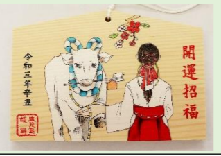
㉓ 千支絵馬 (丑と巫女) (縦 10.5 cm、横 15.5 cm)