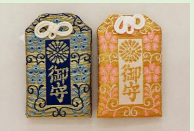
⑦ 身体健全守 (縦 8 cm、横 4.8 cm) (水色・ピンク・青・金)