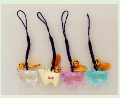
㉕ 千支根付守 (透明・白・青・ピンク) (縦 10 cm、横 2.7 cm)