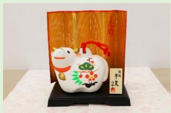
⑲ 開運千支置物 (縦 8.6 cm、横 9 cm) ※縦横は屏風の長さ