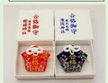
⑫ 合格守 (青・赤) (縦・横 5 cm)