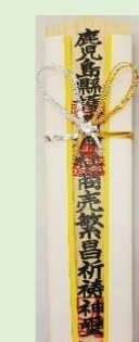
⑥ 商売繁盛木札 (縦 24 cm、横 6.4 cm)