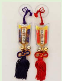
⑰ 交通安全守 (吸盤付) (千支付 水色・ピンク) (縦 13 cm、横 3.3 cm)