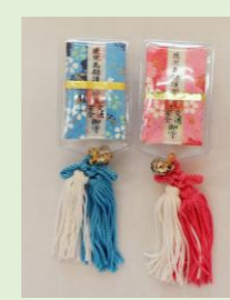
⑱ 交通安全守 (吸盤付) (青・ピンク) (縦 12.5 cm、横 3.2 cm)