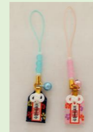
⑭ 交通安全根付守 (青・ピンク) (縦 11 cm、横 2 cm)