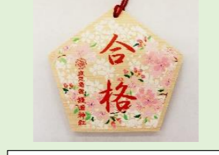
㉒ 合格祈願絵馬 (縦 14 cm、横 15.5 cm)