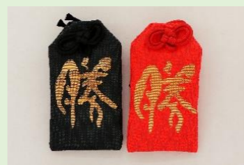
⑪ 勝守 (黒・赤) (縦 7 cm、横 4 cm)