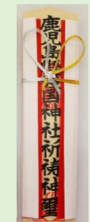
⑤ 護國神社木札 (縦 24 cm、横 6.4 cm)