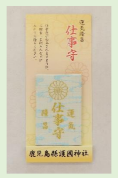
㉗ 仕事守 (縦 6.5 cm、横 4.2 cm) 仕事運が向上するよう、 財布やバックなどに入れ てご加護を願います。