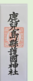
② 護國神社御札 (小) (縦 12 cm、横 6.3 cm)