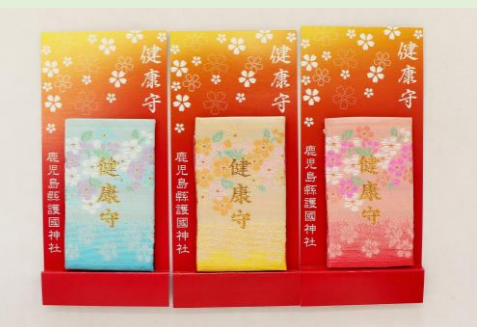
⑧ 健康守 (青・黄・ピンク) (縦 24 cm、横 8 cm)

活火山である桜島の力をいただき、 あらゆる困難に打ち克つよう祈願 された、鹿児島県ならではの御守で す。御神域にて採取し、お清めした 桜島の火山灰が封入されています。