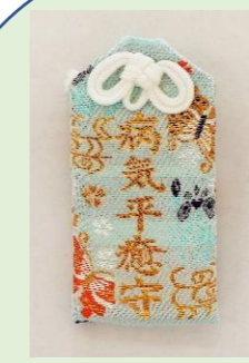
⑩ 病気平癒守 (縦 8.8 cm、横 4 cm)