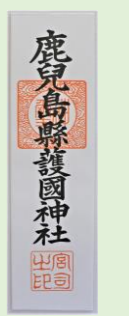
① 護國神社御札 (大) (縦 24.5 cm、横 6.8 cm)